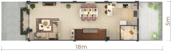
MẶT BẰNG TẦNG 1